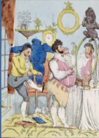
S. W. Fores (pub.), A Cool Pipe in Pall Mall , 1800.