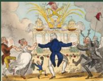
George Cruikshank, The Grand Entertainment , 1814.

During the Regency and in the early years of George IV's reign, Carlton House became the centre of court life, its lavish interiors acting as backdrop to increasingly spectacular entertainments. The building, however, suffered from structural defects and in 1827 it was demolished. Its furnishings were reused in the new architectural schemes at Buckingham Palace and Windsor Castle that became the focus of the final decade of George IV's life.